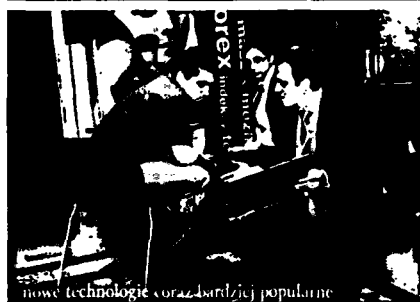
nowe technologie coraz bardziej popularne