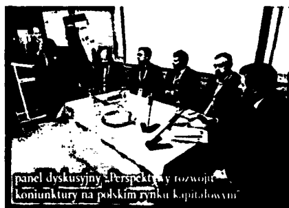
panel dyskusyjny „Perspektywy rozwoju koniunktury na polskim rynku kapitałowym”