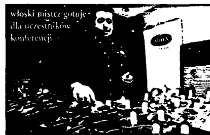
włoski mistrz gotuje dla uczestników konferencji

wielu cennych wskazówek dostarczały bezpośrednie spotkania z Zarządami i przedstawicielami 40 spółek giełdowych.