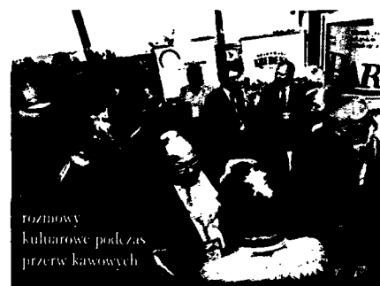
rozmowy kulturalne podczas przerwy kawowych