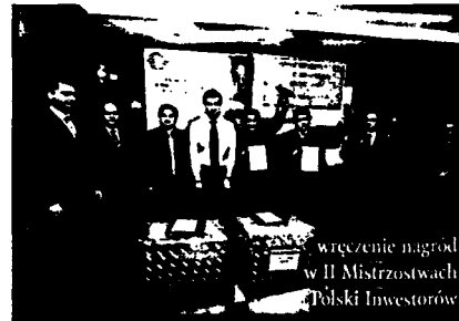
wrećenie nagród w II Mistrzostwach Polski Inwestorów