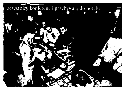
uczestnicy konferencji przybywają do hotelu