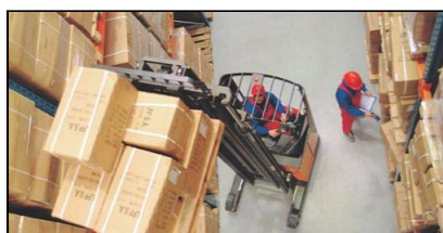
Wielki popyt na urządzenia magazynowe to efekt rosnących obrotów polskich firm

Ponad 600 milionów złotych warte są wózki magazynowe, które w 2006 roku kupili polscy przedsiębiorcy.